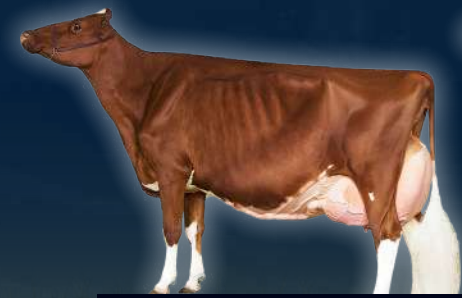
ABUELA PATERNA APPLE-RED EX-96

Cría desteta de 3 meses de edad por el toro de tu elección. Imagínate una hija de la Vaca Joven Más Importante de Colombia y Suramérica en 2023, Campeona Intermedia y Gran Campeona Reservada de la Copa Holstein Suramericana y Agroexpo 2023. COLGANADOS APPLE MARSELLA-ET-EX-92 Máxima clasificación a sus 3 años y dos partos. Date el gusto de programar esta joya por el toro de tu elección. Bisnieta de la gran Jacobs Goldwyn Britany-ET-EX-96, Vaca del Año Canadá 2019, y una de las matriarcas más importantes de la raza a nivel mundial. Por el lado paterno, MARSELLA es hija del toro más exitoso en nuestro programa de crianza DIAMONDBACK, nieta de la Gran Campeona Mundial y Vaca del Millón de Dólares APPLE-RED-EX-96. MARSELLA acaba de terminar su segunda lactancia con 11.910 kgs de leche a 305 días. El valor del lote incluye semen, trabajo de laboratorio, receptora, cría y levante hasta los 3 meses de edad. Colganados ofrece servicio de Cow-Housing al comprador.