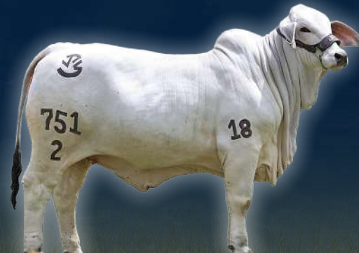
JPS LADY PASARELA L MANSO 751/2 LEGEND MANSO x LADY KARU LUNATICA