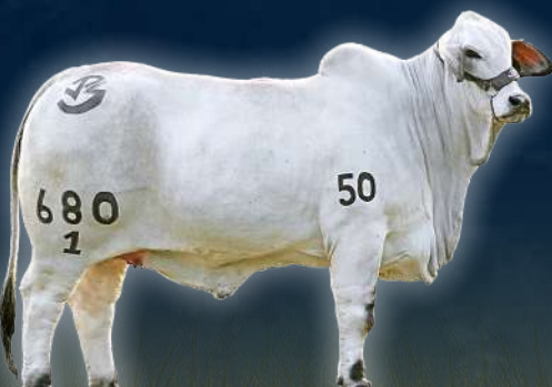
JPS LADY MIRANDA L MANSO 680/1 SIR PANCHO MANSO x LADY KARU LUNATICA