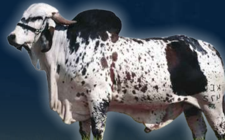
PADRE DE SAMAY C.A.SANSAO