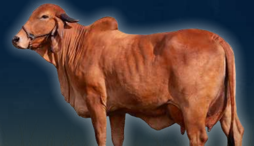
COLGANADOS PINCELADA B+ 88