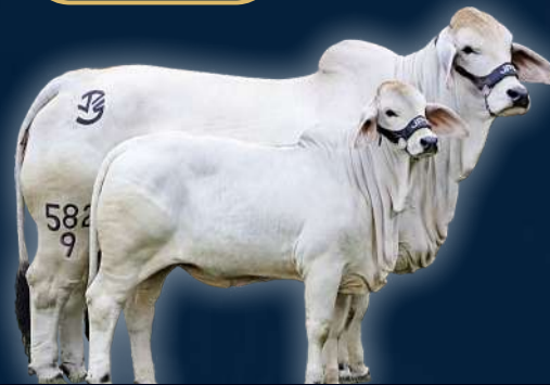
JPS LADY MOON 582/9 MR MOSLEY MANSO x LADY KARU LUNATICA