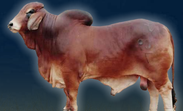
DONADOR SMOKING GUN 109/7

Esta vaca es de gran importancia en la raza ya que es bisnieta de la vaca Medalla de Oro 2649/07, una de las vacas más importantes en la raza, siendo una de las únicas vacas clonadas en Colombia, a su vez hija de la 918 que fue gran campeona en AGROEXPO, una de las ferias más importantes en el país.