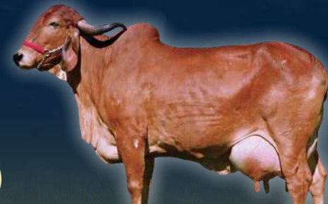
MADRE PROFANA TN DA PALMA