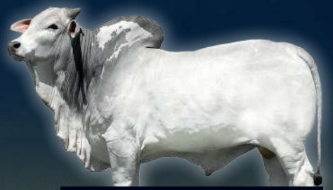
DONADOR CIA LORD DA MATA

ICIAGen: 20,82 / Idesm: 20,80 Rmat: 16,87 / IFRIG: 2,57