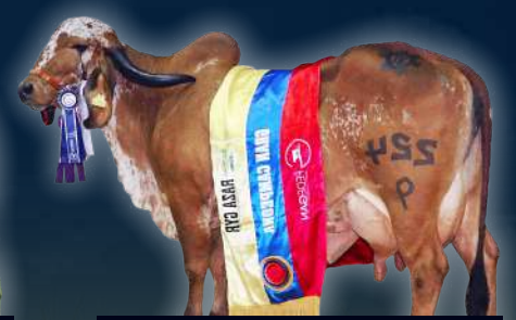
HIJA DE FARDO FARAONA