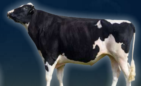
ABUELO PATERNO GENOSOURCE CAPTAIN-ET

GENOSOURCE CAPTAIN-ET STGEN 84943-ET GP-80