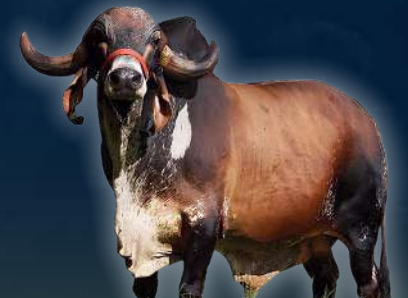
PADRE DE LA PREÑEZ JAGUAR TE DO GAVIAO