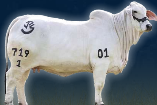
JPS LADY GALACTICA L MANSO 719/1 LAYTON DE MANSO x LADY KARU LUNATICA