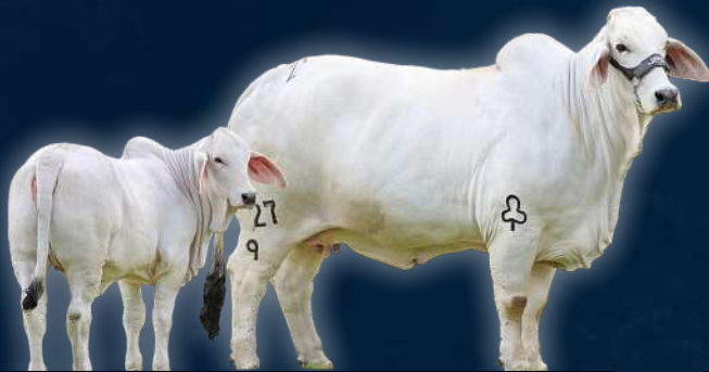
JDH LADY LARISSA MANSO 27/9 MADISON DE MANSO x LADY NINFA MANSO

Este lote es particularmente especial e importante, ya que reúne lo más selecto de JPS Ganadería. Con 20 años de experiencia dedicados al mejoramiento genético de la raza Brahman, JPS Ganadería ha mantenido un enfoque constante en la producción de animales respaldados por las mejores líneas maternas. Ahora, se ofrece la oportunidad de adquirir embriones de las mejores vacas, que pueden ser programadas con los toros disponibles de JPS Ganadería o con aquellos que el comprador prefiera.