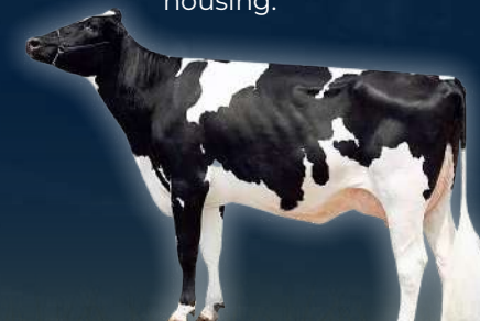
MADRE WINSTAR RENEGADE 5708 VG-85