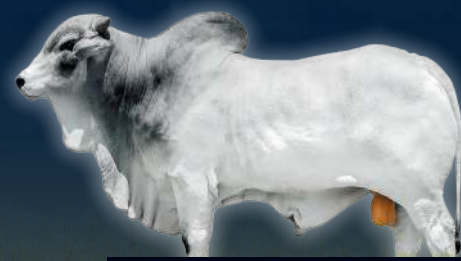
DONADOR CIA ATLAS FS

Semen sexado hembra (Asegurando los nacimientos sean 90% hembras).