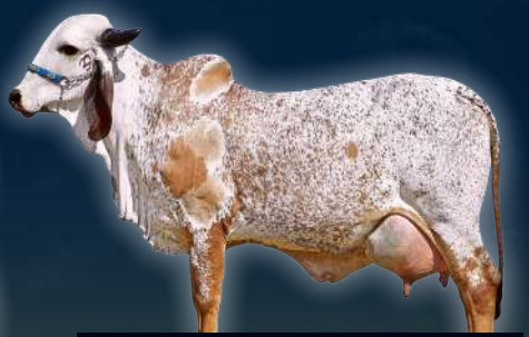
MADRE RAPSODIA FIV DE BRAS