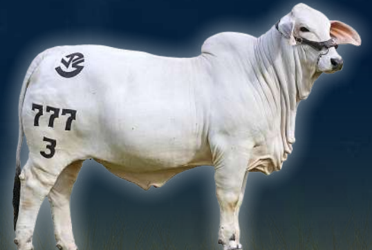
JPS LADY MERLINA L2 MANSO 777/3 SIR JACOB MANSO x LADY LUNITA L MANSO